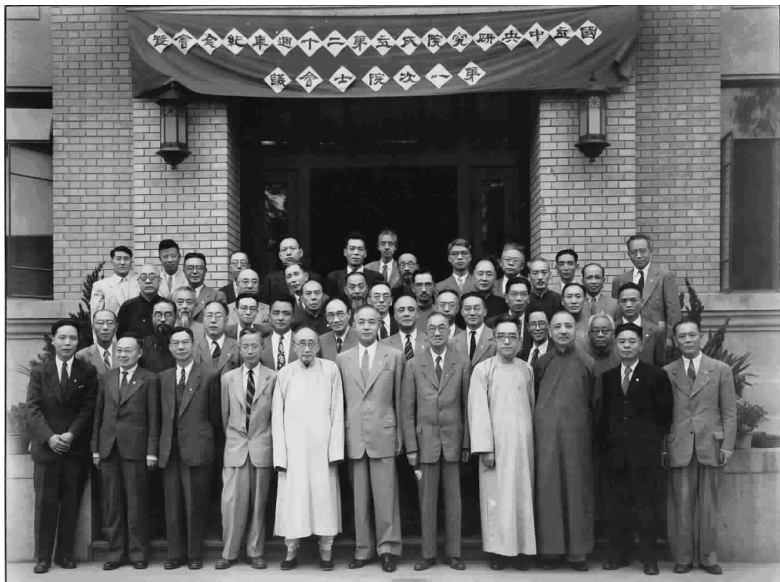
○ 1948年，参加国立中央研究院成立二十周年纪念暨第一次院士会议时全体院士合影，出席人数共48人 左起第一排：萨本栋、陈达、茅以升、竺可桢、张元济、朱家骅、王宠惠、胡适、李书华、饶毓泰、庄长恭 第二排：周鯨生、冯友兰、杨钟健、汤佩松、陶孟和、凌鸿勋、袁贻瑾、吴学周、汤用彤 第三排：杨树达、余嘉锡、梁思成、秉志、周仁、萧公权、严济慈、叶企孙、李先闻 第四排：谢家荣、李宗恩、伍献文、陈垣、胡先骕、李济、戴芳澜、苏步青 第五排：邓叔群、吴定良、俞大绶、陈省身、殷宏章、钱崇澍、柳诒征、冯德培、傅斯年、贝时璋、姜立夫