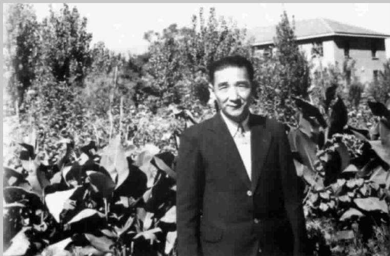
○ 上图 贝老百岁寿星像